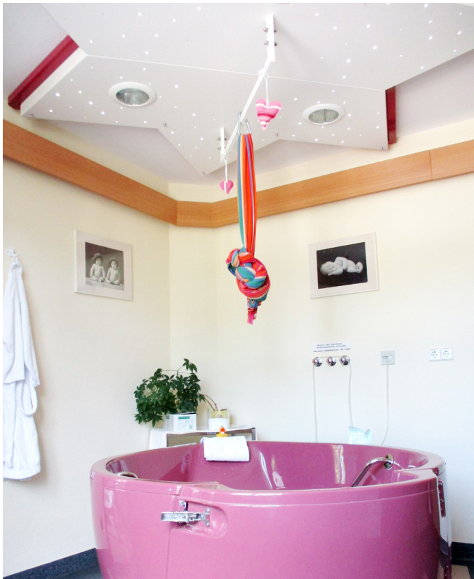
Zum Gebären oder zum Entspannen – unsere Wanne im Kreißsaal.

Auch bei den monatlich stattfindenden Infoabenden (üblicherweise an jedem 1. Mittwoch im Monat) können Schwangere und werdende Eltern alle ihre Fragen stellen. Falls es die Belegung zulässt, wird dabei auch die Möglichkeit geboten den Kreißsaal sowie die Station zu begehen. Die werdende Mutter sollte sich etwa vier Wochen vor dem errechneten Geburtstermin im Kreißsaal Sonneberg vorstellen. Hierfür wird eigens ein Termin vereinbart, um ganz in Ruhe und entspannt das Aufnahmegespräch führen zu können. Das Hebammen- und Ärzteteam setzt alles daran, die Geburt so sanft wie möglich und den Vorstellungen der Patientinnen entsprechend zu gestalten sowie einen natürlichen Geburtsverlauf zu fördern. Dabei lautet das Motto: