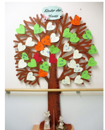
Der Baum steht auf der Station 51 und zeigt alle aktuellen Babys.

Keine Geburt lässt sich planen, keine läuft gleich ab und auch jede Frau findet während der Geburt selbst heraus, was ihr während der Wehen gut tut. Wir unterstützen mit Massagen, Homöopathie, Akupunktur oder einem TENS Gerät (Nervenstimulation). Aber auch mit Medikamenten kann