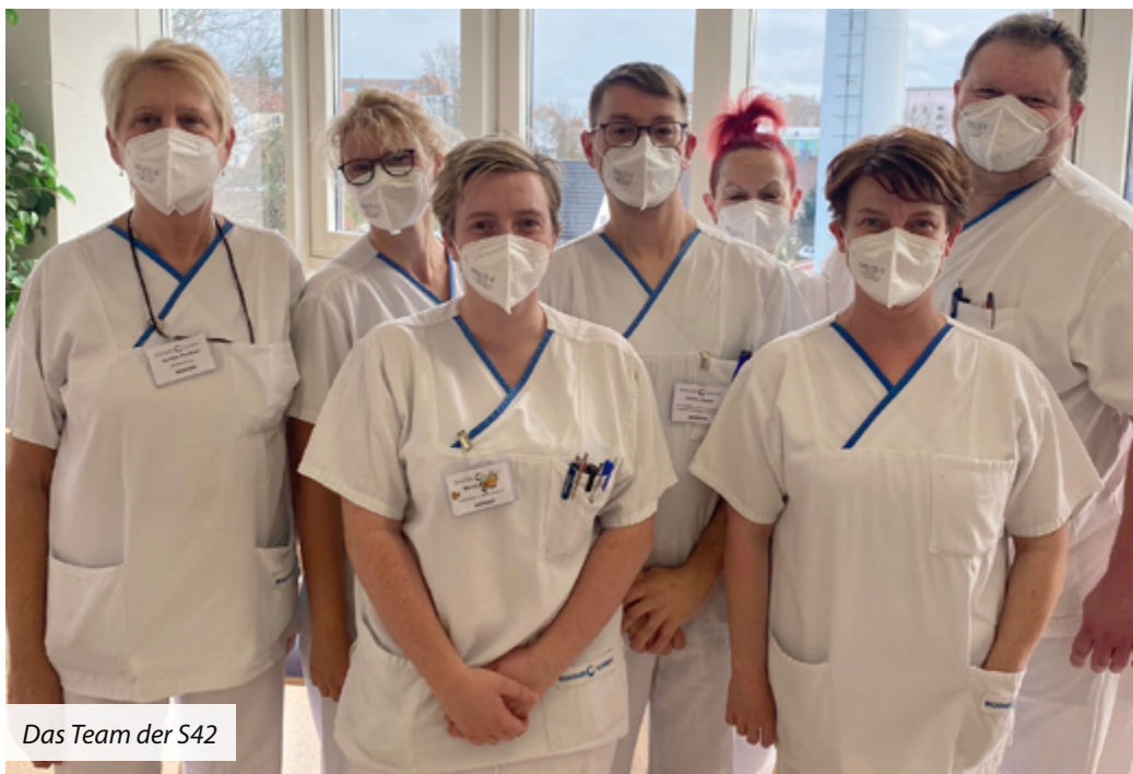
Das Team der S42

Sie lächeln auch unter der Maske, starten engagiert und motiviert in jeden neuen Arbeitstag: das Team unserer S42. Den Optimismus haben sie sich auch in den letzten 2,5 Jahren nicht nehmen lassen. Als ehemals rein pneumologische-kardiologische Station hat das Team seit März 2020 als Corona-Isolations-Station unter besonderer Belastung Herausragendes geleistet. So mussten sie beispielsweise ganztägig in Schutzkleidung arbeiten, den besonderen Hygiene-Anforderungen Rechnung tragen und auch der pflegerische Aufwand zur Betreuung von Corona-Patienten war und ist besonders herausfordernd, angefangen von der ständigen Überwachung von Blutwerten, Körpertemperatur und Sauerstoffsättigung bis hin