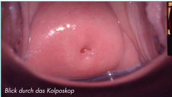
Blick durch das Kolposkop

Die Frauenklinik am Klinikum Coburg bietet eine spezielle Sprechstunde zur Kolposkopie an. Diese dient der Untersuchung des Muttermundes auf besonders schonende Weise . Der Muttermund wird hierbei mithilfe eines speziellen Gerätes (Kolposkop) stark vergrößert dargestellt: